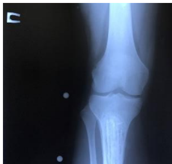
Рентгенограммы до операции.

При проведении первого этапа лечения проведена предоперационная полихимиотерапия, ортезирование с положительным эффектом.