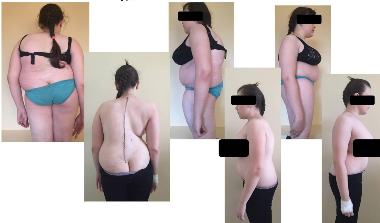
Внешний вид пациента до и после операции

Пациент А. 16 лет. Диагноз: Идиопатический инфантильный левосторонний груднопоясничный сколиоз 4 ст.