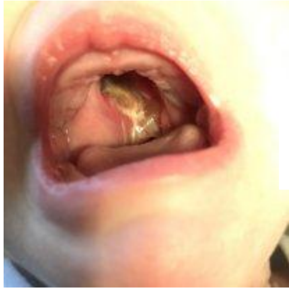
Фибриновый налет расщелины неба

Эпигастральный зонд был удален на 4-ые сутки , трахеостомическая трубка удалена на 6-ые сутки после операции.